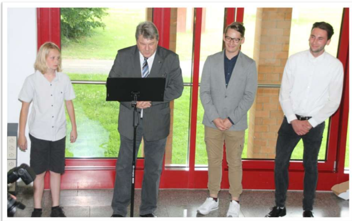
Preisverleihung des Jugendwettbewerbes zur Aufarbeitung des Nationalsozialismus, @Pressestelle Rhein-Erft-Kreis, 2017.

Erinnerung umfasst das Erinnern des Einzelnen oder der Gesellschaft an die eigene oder gemeinsame Vergangenheit. Sie ist geprägt von der Koppelung des Erinnerns an die Gegenwart, da man die Vergangenheit nicht leben kann. Dabei ist gesellschaftliche Erinnerung geplant und für das Bestehen der Gemeinschaft notwendig. Das kollektive Erinnern und das Zulassen verschiedener Positionen kann sich in Erinnerungskultur manifestieren, die auf die Geschichte, die eine Gemeinschaft zusammenhält und prägt, auswirkt. Erinnerungskultur kann dabei ein historischer Ort sein, der heute museale Funktionen ausführt und zum Lernen, Reflektieren, Begegnen und Versöhnen dient. Gleiches gilt für Gedenktage, die einer Gesellschaft Anlass zum Erinnern bieten, wie der Tag des Gedenkens an die Opfer des Nationalsozialismus am 27. Januar und der 08. Mai als Tag der bedingungslosen Kapitulation der Wehrmacht und der Beendigung des Nationalsozialismus in Deutschland.