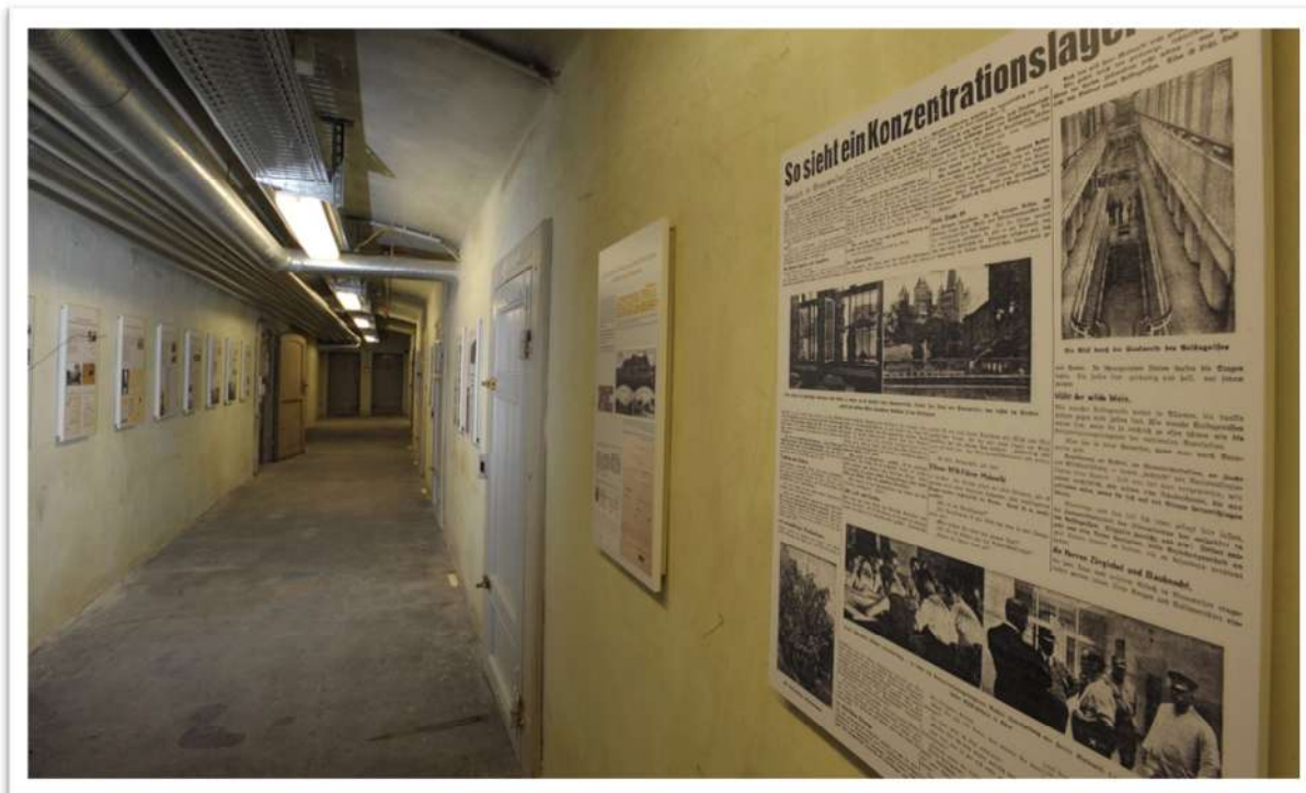
Blick in den Zellentrakt der Gedenkstätte Brauweiler, @ LVR, Ludgar Ströter.