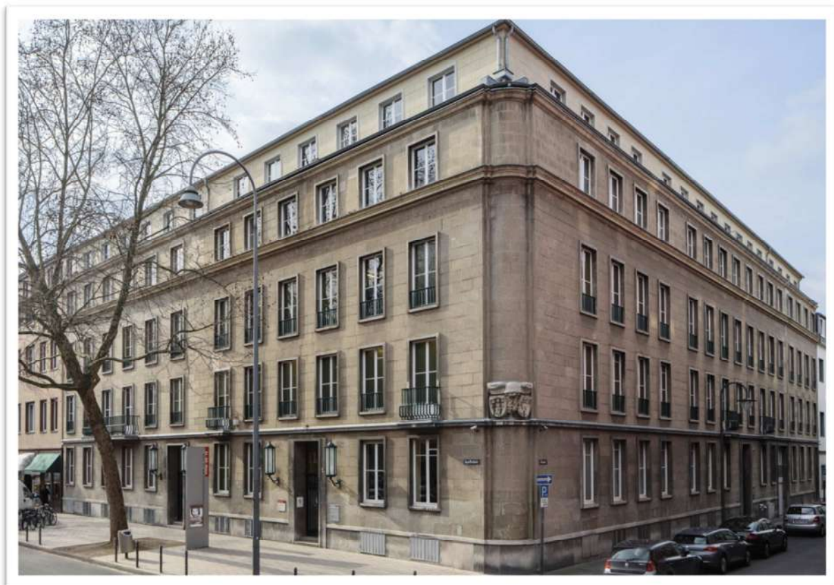
Gesamtansicht EL-DE Haus Köln.

Adresse Appellhofplatz 23-25, 50667 Köln Internet https://museenkoeln.de/ns-dokumentationszentrum/default.aspx?s=314 Kontakt 0221-2212-6332 Träger Stadt Köln Beschreibung Das EL-DE-Haus ist ein nach den Initialen seines Erbauers Leopold Dahmen genanntes ursprünglich als Wohn- und Geschäftshaus konzipiertes Haus in Köln im Stadtteil Altstadt-Nord, das als Gestapodienststelle und Gefängnis zwischen 1935 und 1945 zum Inbegriff nationalsozialistischer Schreckensherrschaft in Köln wurde. Das heute dort untergebrachte NS-Dokumentationszentrum hat sich 1979 aus dem Stadtarchiv der Stadt Köln hinaus zu einer eigenständigen Organisation entwickelt. Seit 2008 gehört es zum