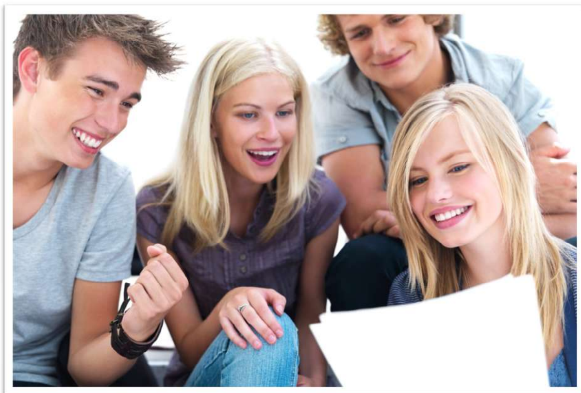
Jugendliche forschen zur Geschichte des Nationalsozialismus, © Yuri-Arcurs, fotolia.de.

Die Zusammenarbeit mit den Einrichtungen soll über Kooperationen und entsprechenden Zuwendungen an diese vorgenommen werden. Die genauen Rahmenbedingungen sind den Kooperationsverträgen zu entnehmen. Gewünscht ist, dass das vorliegende Rahmenkonzept damit auch Einfluss auf schulinterne Arbeitspläne nimmt.