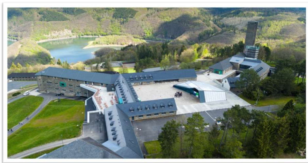
Luftbild der Gesamtanlage Vogelsang IP, © Vogelsang IP.